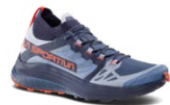
644322 MOONLIGHT / CHERRY TOMATO