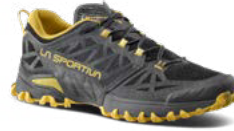
900735 CARBON / BAMBOO