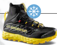
BLIZZARD GTX 370g 7 mm