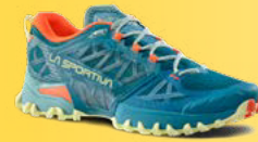
733736W EVERGLADE / ZEST