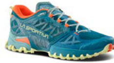
733736 EVERGLADE / ZEST