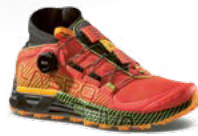
CYKLON 315g 7 mm