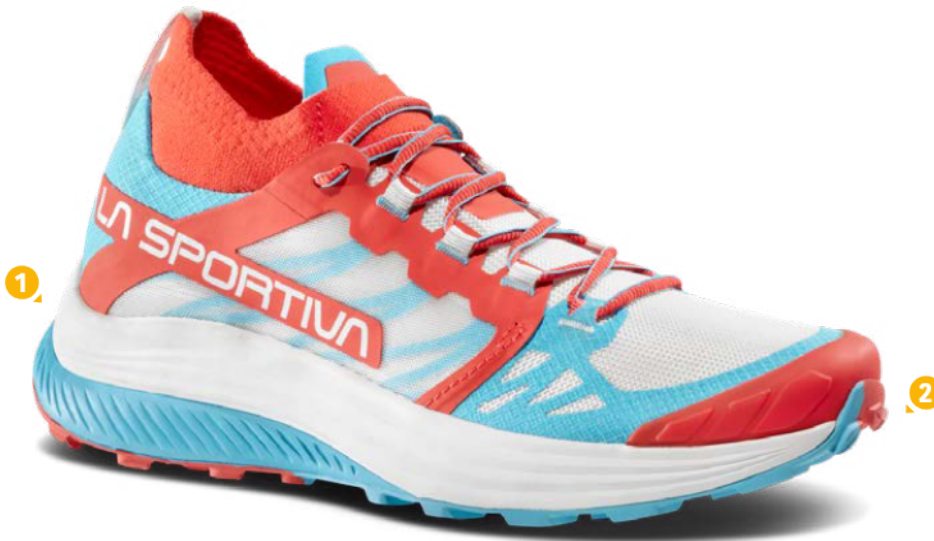
402602 HIBISCUS / MALIBU BLUE