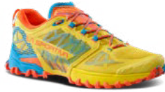
735322 BAMBOO / CHERRY TOMATO