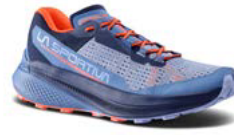
645644 STONE-BLUE / MOONLIGHT