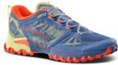
644736 MOONLIGHT / ZEST