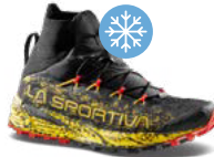
URAGANO GTX 355g 8 mm