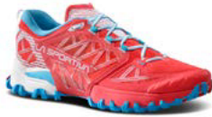
402602 HIBISCUS / MALIBU BLUE

Size: 36 - 43 (+ 1/2) Weight: 250 g (half pair)