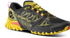
999100 BLACK / YELLOW