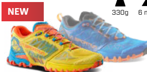
BUSHIDO II GTX 330g 6 mm