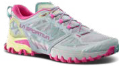
913411 MOON / SPRINGTIME