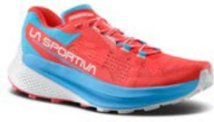
402602 HIBISCUS / MALIBU BLUE

Size: 36 - 43 (+ 1/2) Weight: 230 g (half pair)