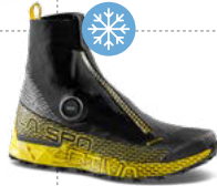
CYKLON CROSS GTX 355g 7 mm