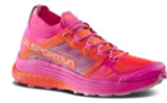
322411 CHERRY TOMATO / SPRINGTIME