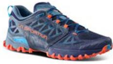
643322 DEEP SEA / CHERRY TOMATO