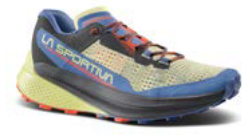
736644 ZEST / MOONLIGHT