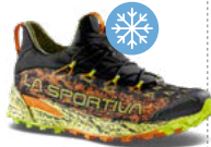
TEMPESTA GTX 330g 8 mm