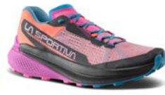
412411 ROSE / SPRINGTIME