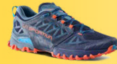
643322W DEEP SEA / CHERRY TOMATO